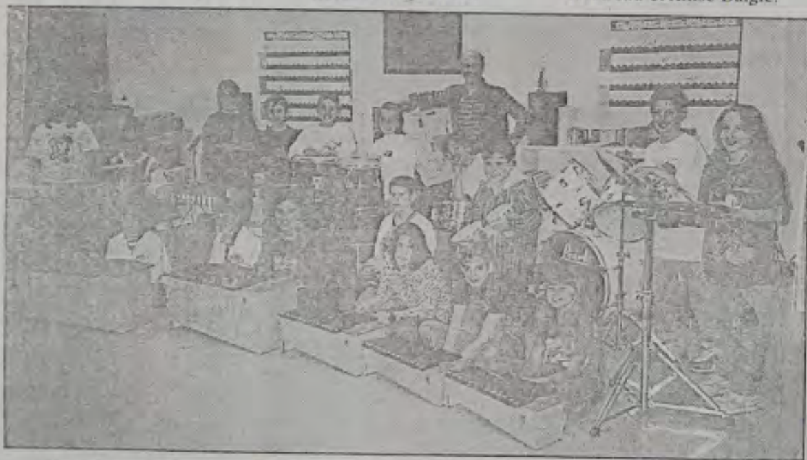
Une classe de musique de l'école W.-F. Boisvert de Rogersville.